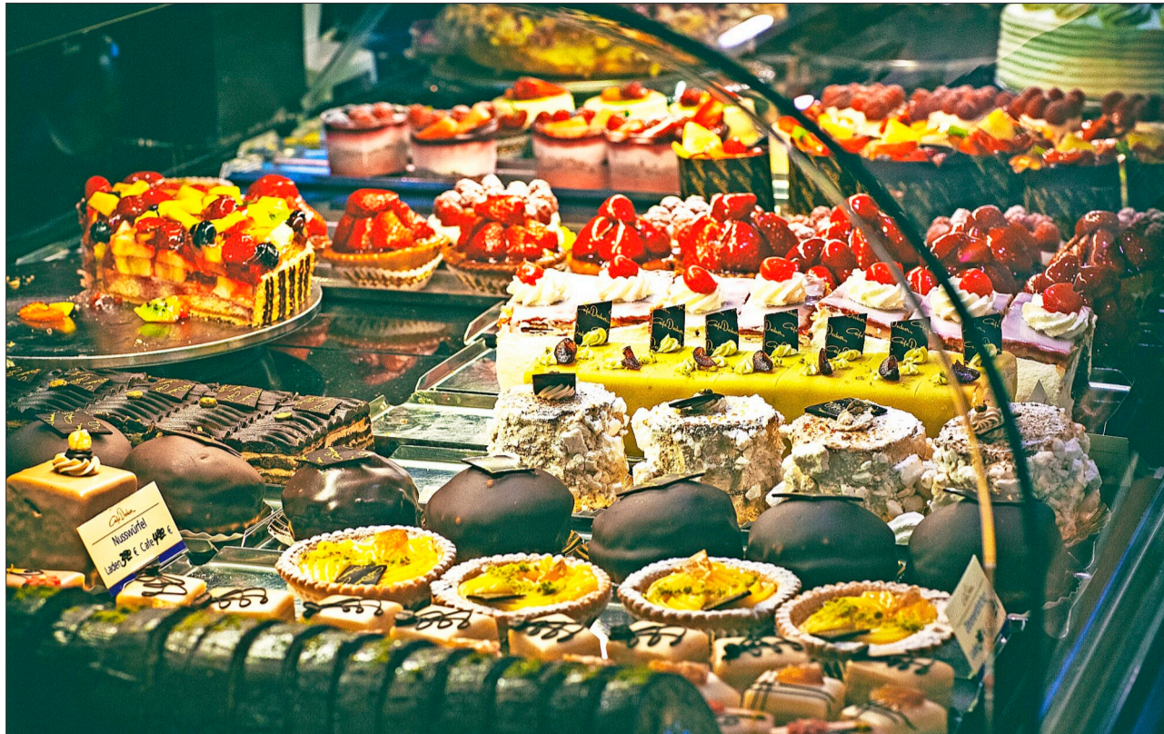
Schau mich erst an, und dann iss mich: Kuchentheke im Café Decker in Staufen.